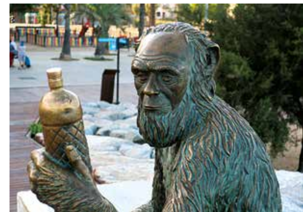
Escultura Anís del Mono.

La platja de l'Estació 18 deu el seu nom a l'estació de ferrocarril l'edifici del qual veurem a la nostra esquerra. Aquesta platja és una de les més cèntriques i populars de la ciutat on trobarem tota mena de serveis de restauració i per al bany. Quan arribem a l'altura de l'estació de fer-