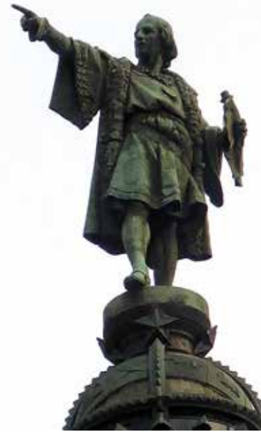
Monument a Cristòfol Colom.

l'Exposició Universal de Barcelona de 1888. La lògica ens diu que el dit de Cristòfol Colom hauria d'estar assenyalant a Amèrica; tanmateix, indica la direcció per anar a Mallorca. Iniciarem