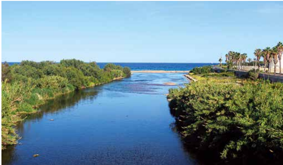
Desembocadura del riu Besòs.

observar un incipient bosc de ribera colonitzat amb tamarius i canya i amb nombroses aus com gavines, corbs marins, ànecs i esplugabous. No sempre ha tingut aquest aspecte tan naturalitzat doncs fins a finals del segle passat el riu era una veritable claveguera a cel obert on anaven a parar els abocaments d'aigües fecals urbanes i residus líquids industrials. La progressiva construcció de depuradores per a les aigües residuals dels nuclis urbans i una política de tolerància zero amb les activitats industrials contaminants va permetre la millora de la qualitat de les aigües i el retorn de la vegetació i fauna autòctona. Fins i tot la llúdriga ha colonitzat de nou la conca del Besòs i de tant en tant algun exemplar es deixa veure al tram final del riu. La cirereta del pastís ha estat la construcció del Parc Fluvial del Besòs 11, de nou quilòmetres de llargada, al llarg dels municipis de Montcada i Reixac, Barcelona, Santa Coloma de Gramenet i Sant Adrià de Besòs que en aquest tram de la desembocadura té un