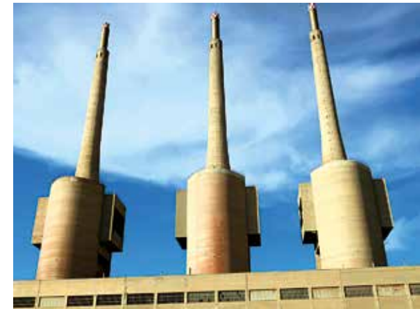
Les Tres Xemeneies.

a conservar-les. El 2016 Endesa va cedir gratuïtament el terreny a l'ajuntament i, per tant, també les torres i la nau. Ara, les institucions públiques liderades pel Departament de Cultura de la Generalitat de Catalunya han programat la creació de la Catalunya Media City, un projecte de centre digital, audiovisual i del videojoc que promet convertir aquesta zona en un pol internacional per al sector audiovisual i digital començant amb la rehabilitació de l'emblemàtica