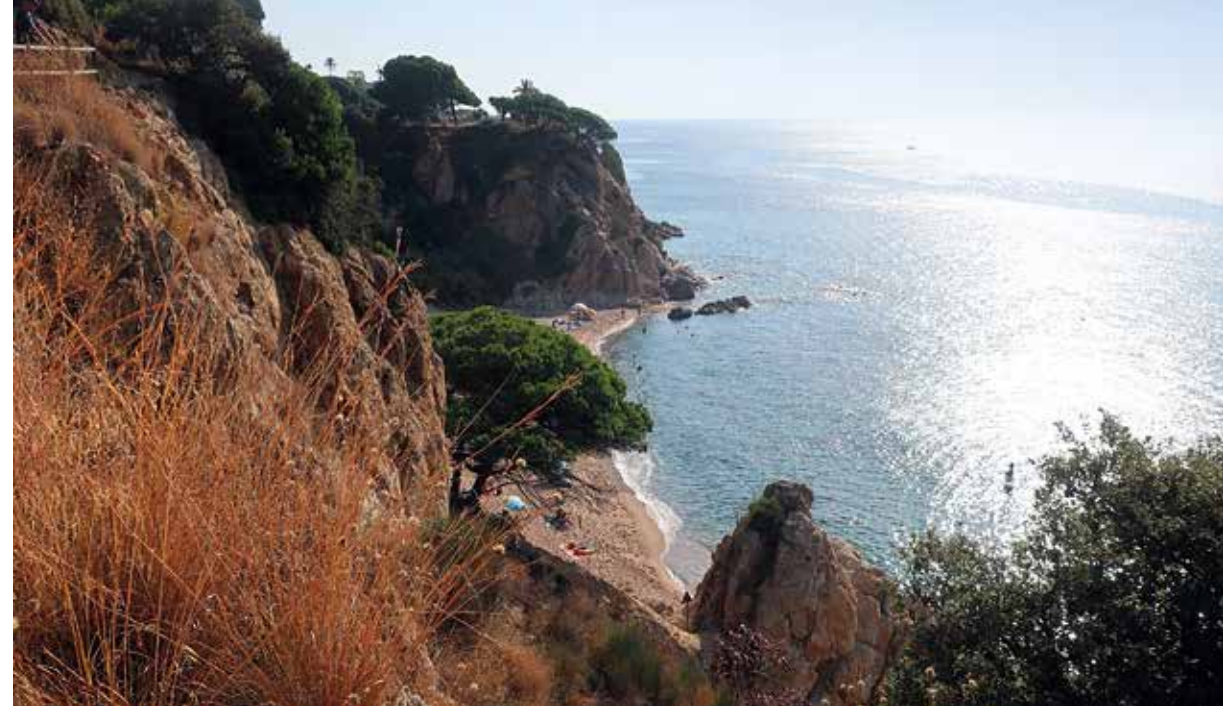
Platja de les Roques de Calella.

La costa de Barcelona és un petit miracle si considerem el seu estat a la segona meitat del segle XX i primers anys del segle XXI. Durant molt de temps, les platges i zones circumdants eren l'espai de treball de les activitats relacionades amb el mar, l'eixida dels pobles on abocar els residus, l'espai inútil on instal·lar les vies del tren, el racó on creixien les xaboles o l'àrea ideal per a indústries contaminants. Això va anar canviant a poc a poc gràcies als corrents higienistes que posaren de moda els banys d'aigua de mar i de sol. El tren va facilitar que les famílies adinerades de Barcelona passessin llargues temporades d'estiu als pobles del Barcelonès, el Maresme i la Selva marítima i que fins i tot es fessin construir elegants cases seguint els corrents arquitectònics de cada època. Als anys seixanta i setanta del segle passat va créixer exponencialment el turisme de