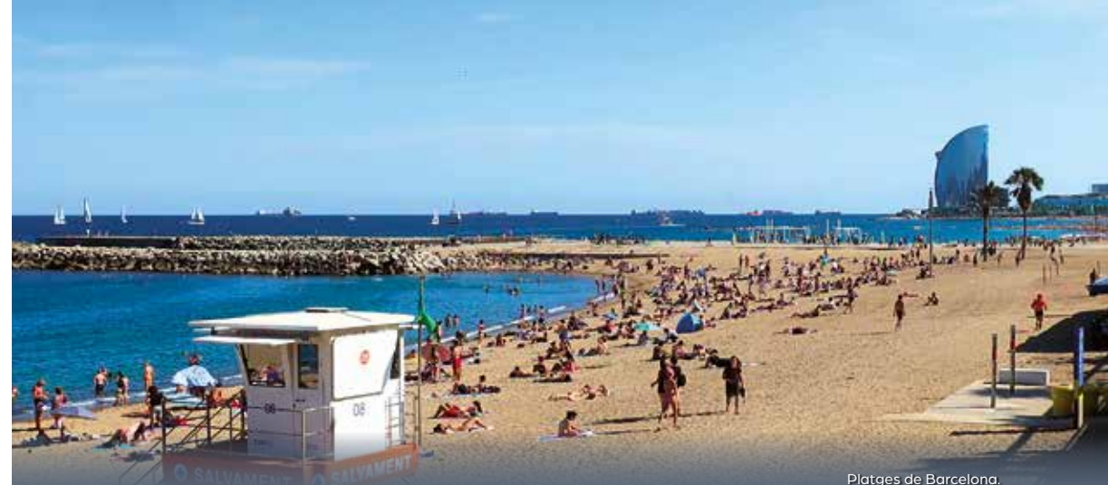
Platges de Barcelona.

observar un incipient bosc de ribera colonitzat amb tamarius i canya i amb nombroses aus com gavines, corbs marins, ànecs i esplugabous. No sempre ha tingut aquest aspecte tan naturalitzat doncs fins a finals del segle passat el riu era una veritable claveguera a cel obert on anaven a parar els abocaments d'aigües fecals urbanes i residus líquids industrials. La progressiva construcció de depuradores per a les aigües residuals dels nuclis urbans i una política de tolerància zero amb les activitats industrials contaminants va permetre la millora de la qualitat de les aigües i el retorn de la vegetació i fauna autòctona. Fins i tot la llúdriga ha colonitzat de nou la conca del Besòs i de tant en tant algun exemplar es deixa veure al tram final del riu. La cirereta del pastís ha estat la construcció del Parc Fluvial del Besòs 11, de nou quilòmetres de llargada, al llarg dels municipis de Montcada i Reixac, Barcelona, Santa Coloma de Gramenet i Sant Adrià de Besòs que en aquest tram de la desembocadura té un