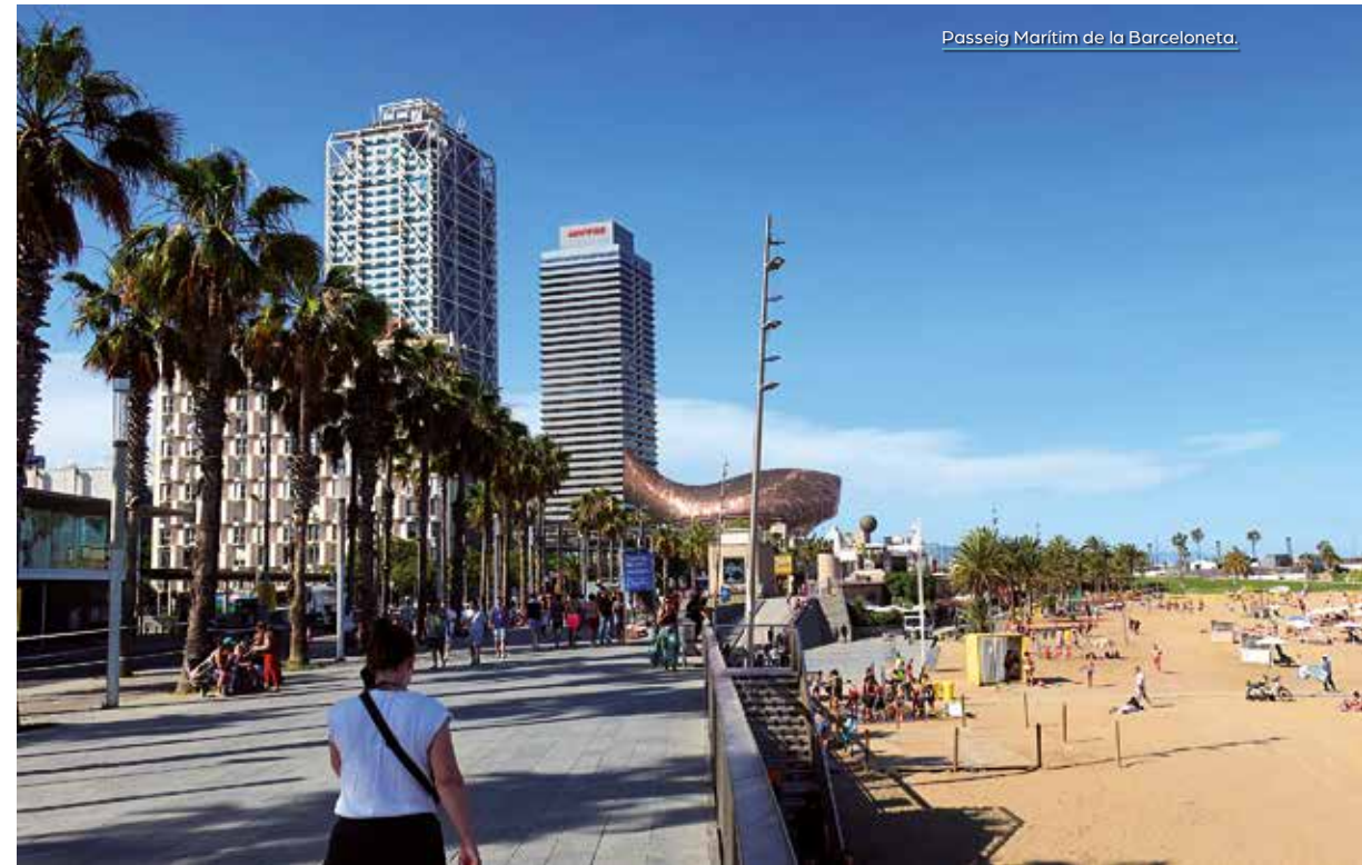
Passeig Marítim de la Barceloneta.

l'afusellament en un paredó proper de 1695 republicans i 11 republicanes per part del règim franquista. També és important recordar que en aquesta zona de Sant Adrià de Besòs s'aixecava el gran poblat de xaboles del Camp de la Bota que amb l'adjacent poblat barceloní de Pequín van acollir fins a 745 famílies amb un total de 3415 persones. Amb la creació del polígon d'habitatges de la Mina l'any 1974 aquest barri es va anar desmantellant fins que el 1989 es van enderrocar les últimes barraques. Tot seguit entrarem en la Gran Esplanada 8 que amb una superfície total de 8,4 hectàrees és considerada com una de les places urbanes més grans del món. Al fons veurem aixecar-se una de les