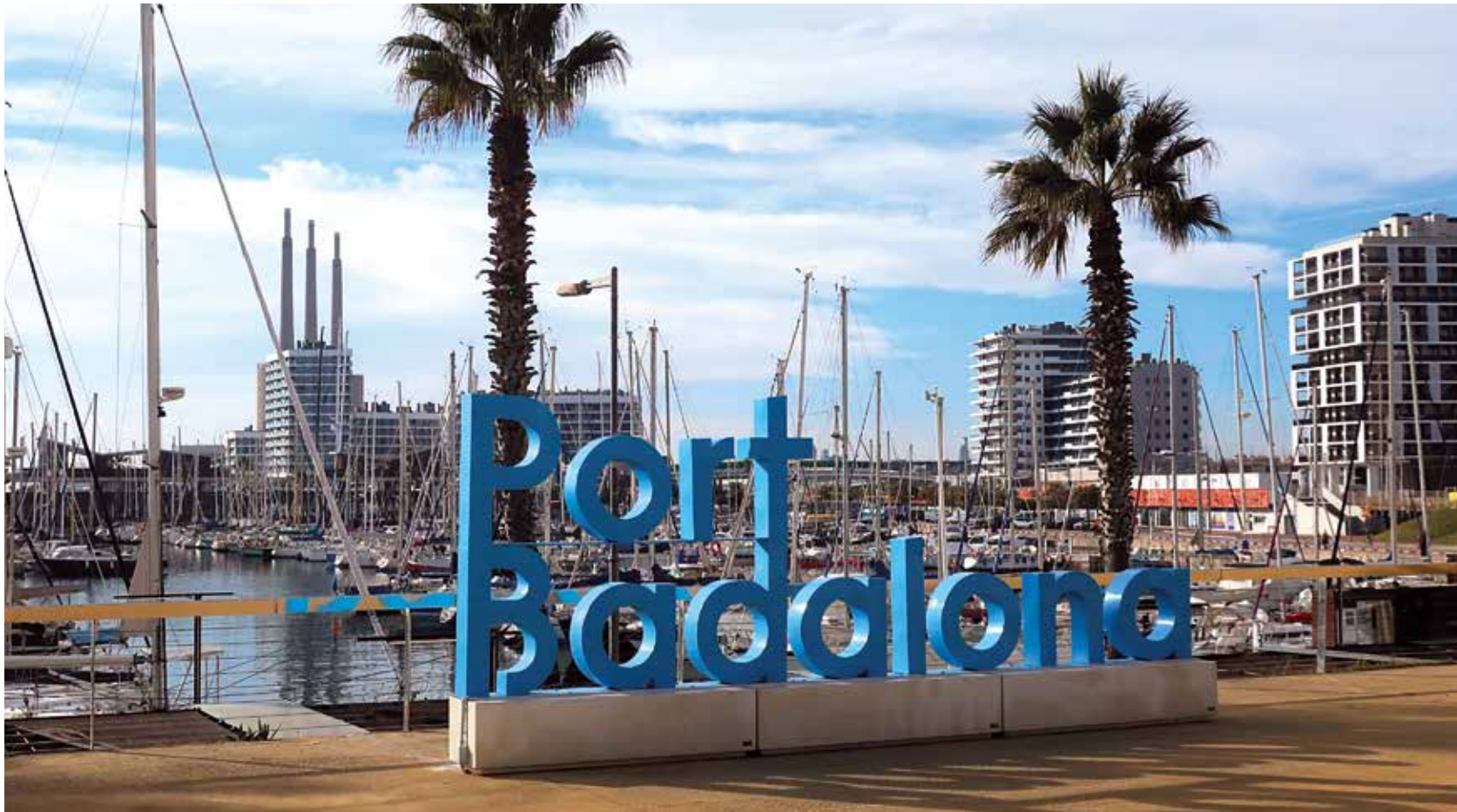
Port de Badalona.

caràcter més assilvestrat. Per un camí lateral al riu, accedirem al pont sobre el Besòs per travessar-lo i accedir al municipi de Sant Adrià de Besòs. Aquí cercarem el primer accés a la nostra dreta per creuar el parc del Litoral fins arribar a la platja del Litoral.