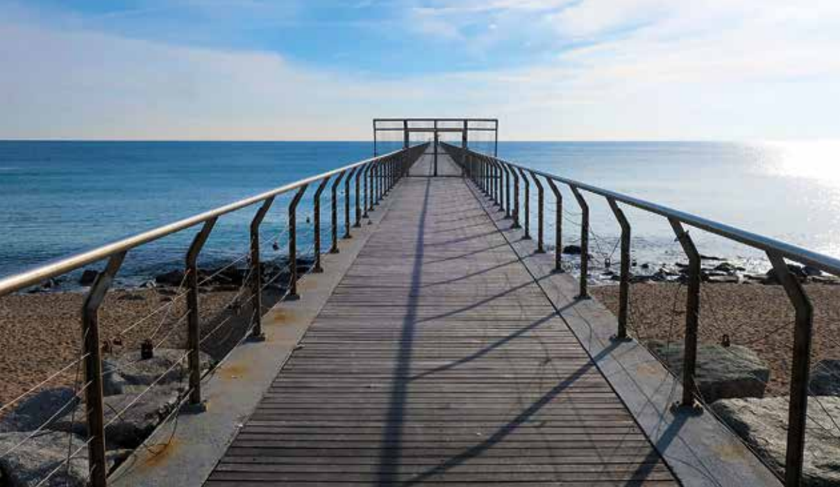
Pont del Petroli.

La platja que segueix a la marina té el curiós nom de la platja del Coco 14. La raó és la presència de l'antiga fàbrica de la Companyia Auxiliadora per al Comerç i la Indústria (CACI), una empresa del sector químic que produïa midó i sabons, com el d'olor de coco. L'edifici de maó de la CACI (Jaume Botey i Barriga, 1899) es va inspirar en l'arquitectura industrial anglesa i des de 1998 és de propietat municipal havent estat rehabilitat. Hi ha hagut diferents propostes d'ús per a aquest espai com, per exemple, ser la seu del museu del Còmic i la Il·lustració de Catalunya. Tanmateix, el fet és que fins ara continua sent un espai buit i sense utilització. A tocar del CACI veurem la plaça del Patí de Vela 15 presidida per l'estàtua L'equilibrista (Eulàlia Monés Gresely, 2006). La següent fita del nostre recorregut és el pont del Petroli 16. Al peu del pont veurem una escultura dedicada al popular personatge de l'etiqueta de l'Anís del Mono (Susana Ruiz Blanch, 2012). El pont del Petroli és un